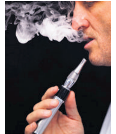
Les vapoteurs augmentent en Suisse, mais se fournissent à l'étranger.

de l'autre côté de la frontière, avant d'aller la chercher. D'autres tentent le coup de la poste restante. «Mais j'ai été dénoncé par un concurrent», lâche-t-il. La sanction est graduelle: amendes, puis fermeture administrative du commerce. Même si cela ne dure que trois ou quatre jours, ils ne peuvent se le permettre. Les affaires sont moroses: même pour les pièces de rechange (batteries, mèches, etc.), les gens ont tendance à les acheter en France, en même temps que les fioles de nicotine. «Au Canada, la nicotine est aussi officiellement interdite, mais les inspecteurs ferment les yeux en attendant que ça change. C'est du simple bon sens. Veut-on lutter, oui ou non, contre le tabac? Car chacun sait que c'est la combustion qui est nuisible», plaide encore Julian Solomon. Dans le même ordre d'idée, Helvetic Vape souhaite qu'une ordonnance autorise la vente de fioles avec nicotine d'ici à l'entrée en vigueur de la loi, afin que les commerces ne coulent pas. «La clientèle est là, rappelle Alain Vaucher. Il n'y a pas de statistique précise, mais la courbe des consommateurs suit celle de la France. On peut donc dire qu'il y a près de 200 000 vapoteurs en Suisse.» Ivan Radja